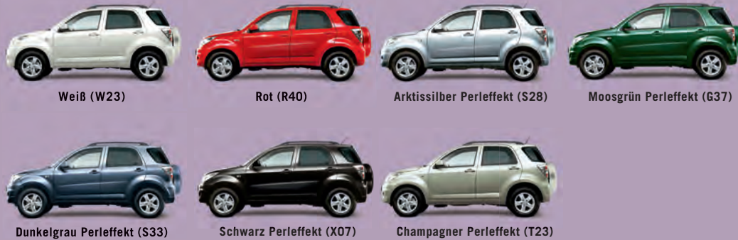
Abb. zeigen Terios Top 4WD.